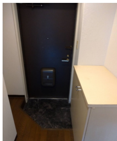
玄関（左側に洗濯機置き場があります）