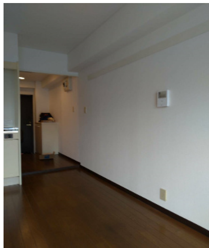
モニタ付きドアホン新規設置済